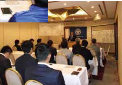
香川県東かがわ市倫理法人会 モーニングセミナー 平成26年12月16日(火)